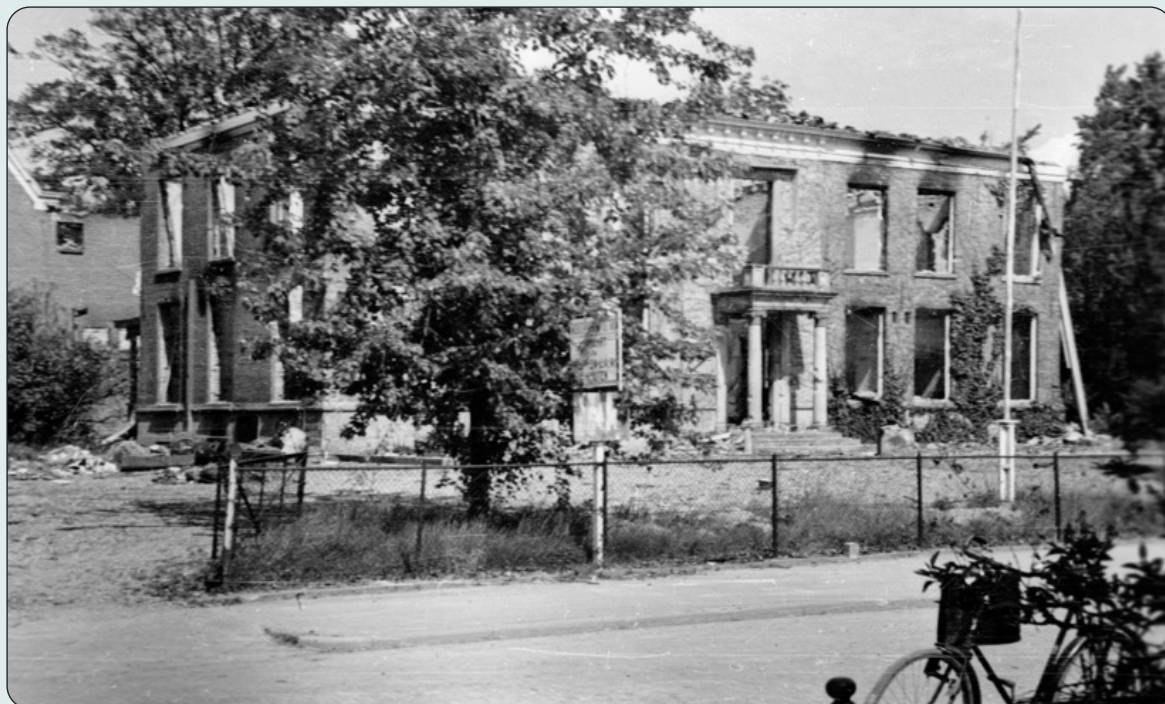
Huis Klarenbeek na de Slag om Arnhem