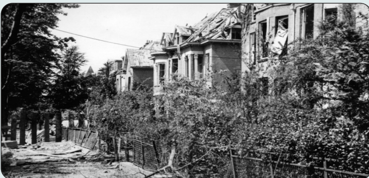
Zwaar beschadigde huizen tussen de Velperweg en Oude Velperweg