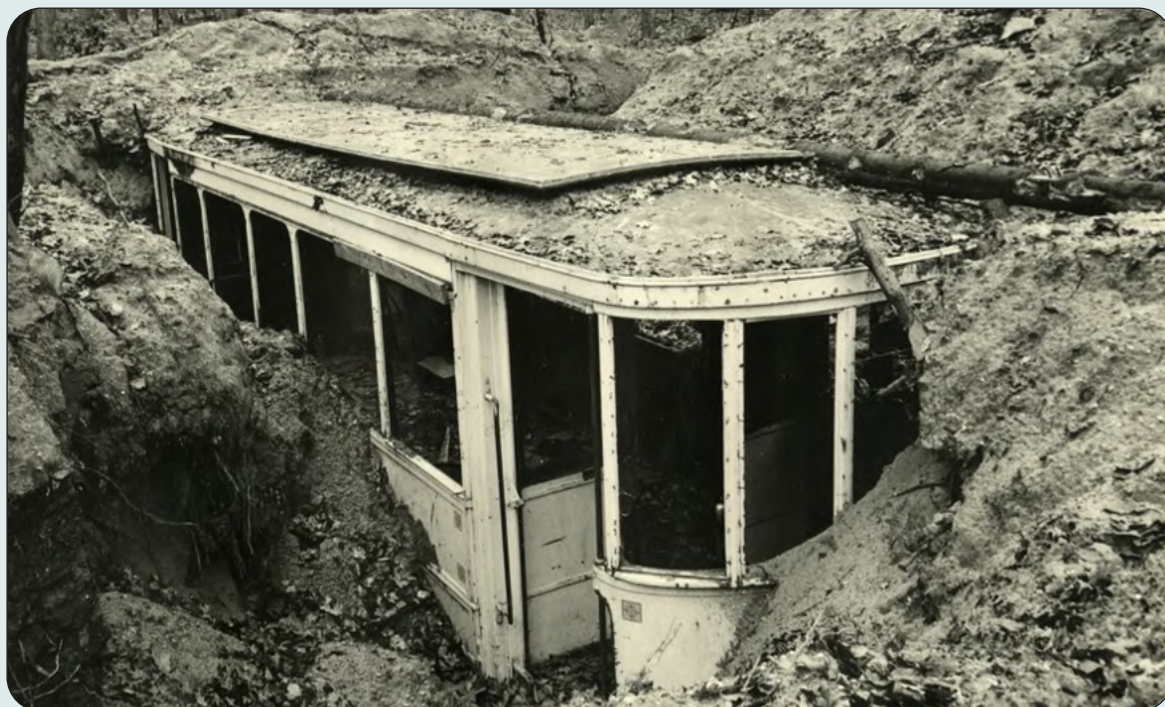
Ingegraven tram bij Rennenenk

De volgende Nieuwsbrief verschijnt rond eind november / begin december